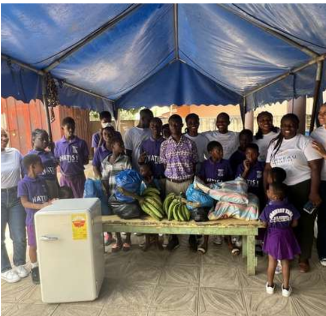
Donation alimentaire à l'orphelinat