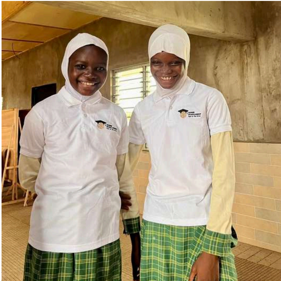
Jeunes bénéficiaires de notre programme Sonne Scholarship

Parfois, un sourire est une résistance douce. Une façon de dire : je suis encore là, et je crois encore. Et dans sa simplicité, il devient un rappel précieux que l'espoir, même silencieux, est déjà une victoire.