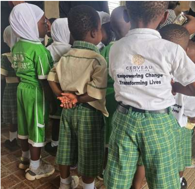
Nos jeunes étudiants boursier