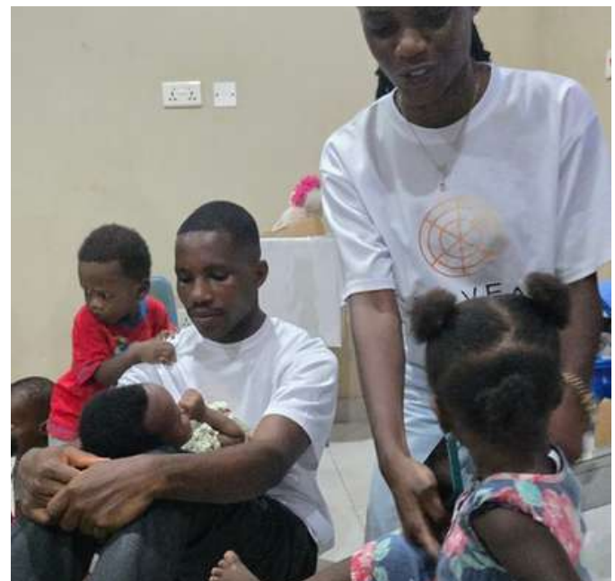
Visite de la pouponnière avec les bénévoles